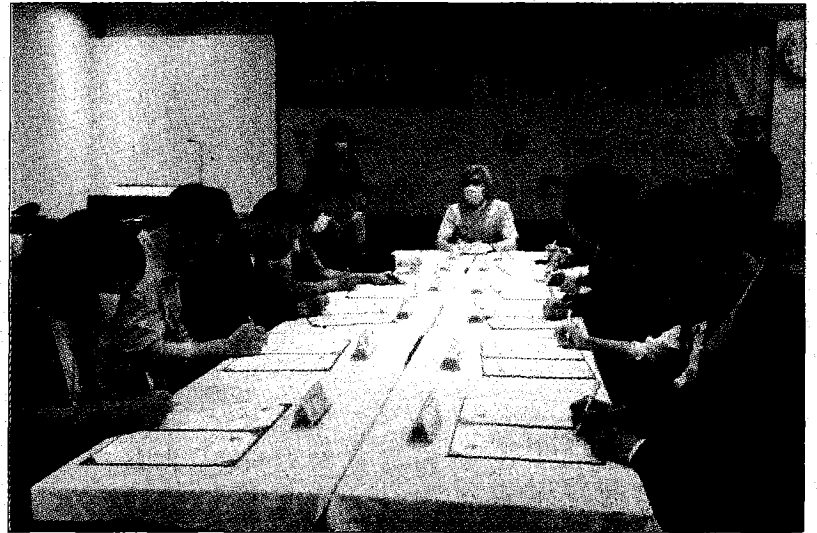
弘光科大與11家美髮企業簽約組人才培育聯盟。