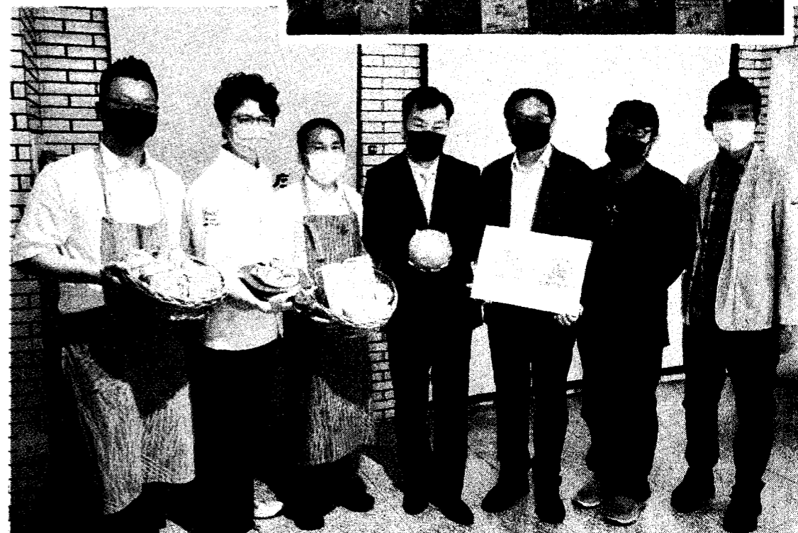
「吳寶春烘焙學院」新品牌進駐台南崑山科技大學，首推客家系麵包，呼應客家烘焙運動。這次研發新品頂客家風味麵包即日起於全台吳寶春店上市。