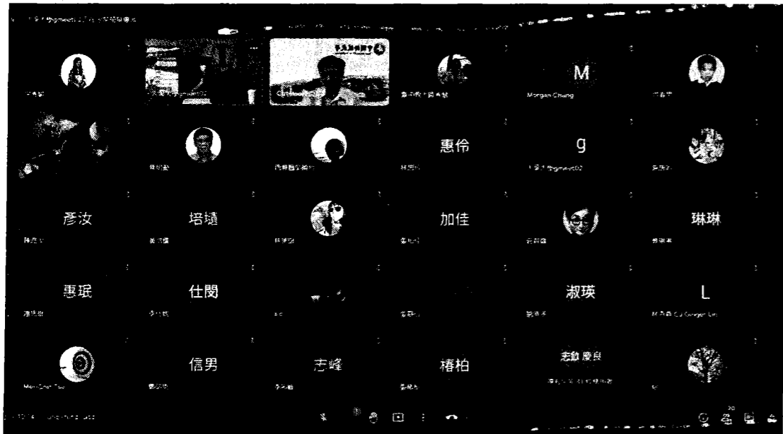
大葉大學華語教學中心線上師培課程，有來自多個國家的老師報名。