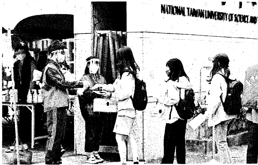
四技二專統測昨日考試，考生進入考場前接受酒精消毒及量測體溫。