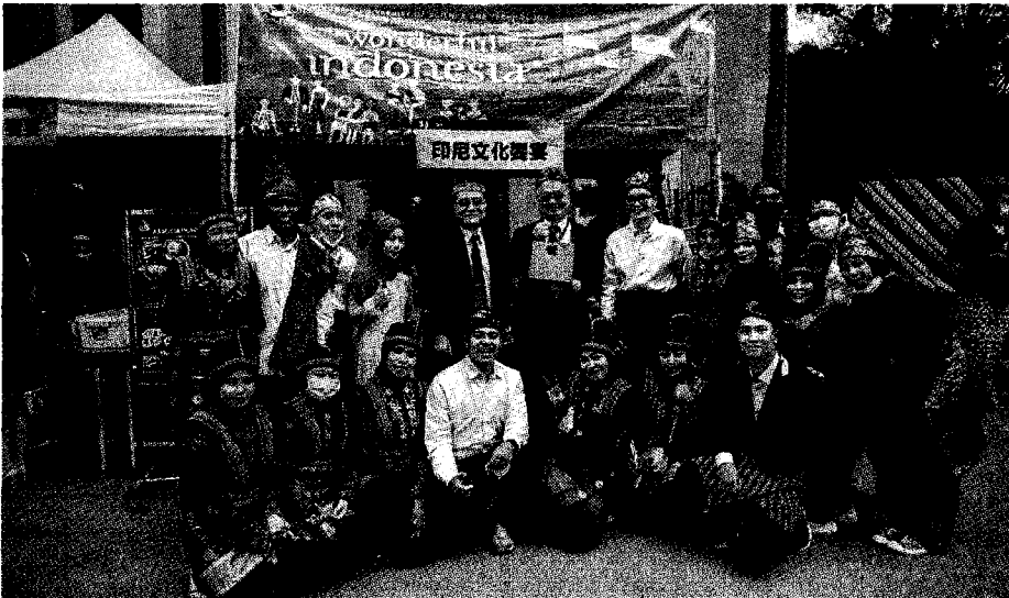
明新科大獲駐印度尼西亞代表處公告為該國技職院校生海外大學合作夥伴學校。