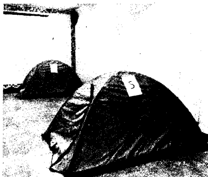
台大確診生指出，被校方安排住進會議室，並貼出帳篷照。網酸：台大小方艙。