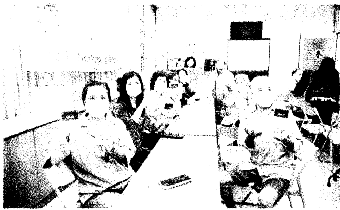
↑嘉藥食品系師生團隊教導阿蓮區長者製作小鮮肉生吐司。(校方提供)