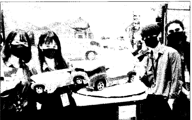
→南台創設系畢業專題學生設計口字型漏斗結構沿路收取式垃圾車，只需司機一人進行工作。

車而跌倒等。 團隊表示，沿路收取式垃圾車是將車頭改為口字型漏斗結構，內部構造則以夾子夾取垃圾桶，使垃圾車可以一邊行駛一邊收取多個垃圾桶而不必停靠，這樣的設計，除了收取速度更快捷，也節省人力物力。