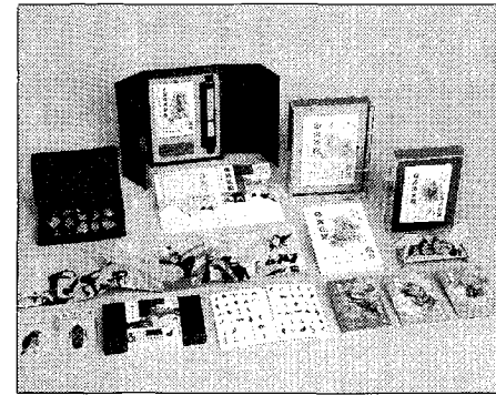
「自然信託計劃」榮獲社會變革推廣設計類金獎。

中國科大視傳系經年鼓勵優良學生作品參與國際競賽，每年都是國內外各類競賽獲獎的常勝軍，中國科大視傳系教師皆具業界實務經驗與豐富學養，培育學生積極參與國內外各項競賽，將設計放眼全球，近年在世界設計舞台深受國際肯定，多元創新呈現視傳系師生跨域學習的成果；更積極推動業界教師參與教學與活化設計實踐發展，教學成效卓越，在此環境薰陶下，畢業生甚受業界的歡迎與各界肯定，未來不凡表現值得期待。