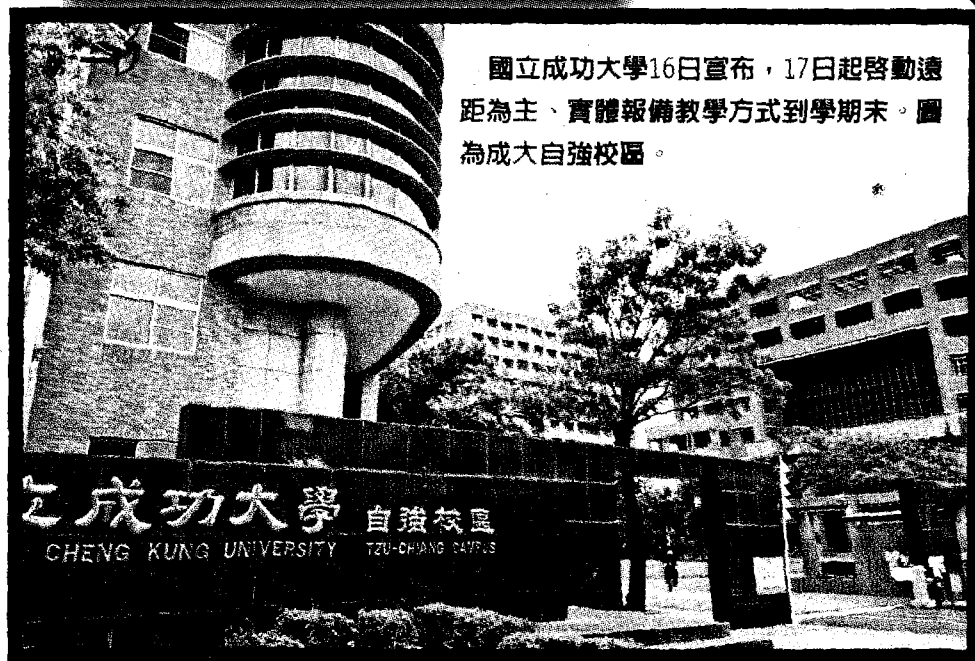
國立成功大學16日宣布，17日起啓動遠距為主、實體報備教學方式到學期末。圖為成大大自強校區。