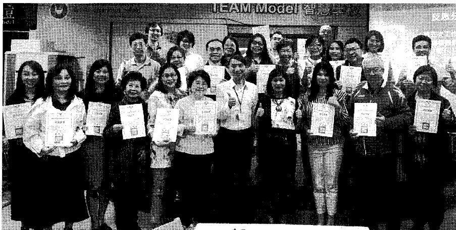
新北工作坊結訓頒授研習證書（資料照）。（圖：新北市教育局提供）

教育局表示，透過這幾年專案的合作，看到學校老師們優化課程與教學，學生的學習也展現出課綱的精神，未來將提供學校教師更完整的支援協助，使教師們對於課綱能更全面的掌握，並能用專業轉化為課程，引導學生步入素養殿堂，實際解決現在與未來生活的問題。