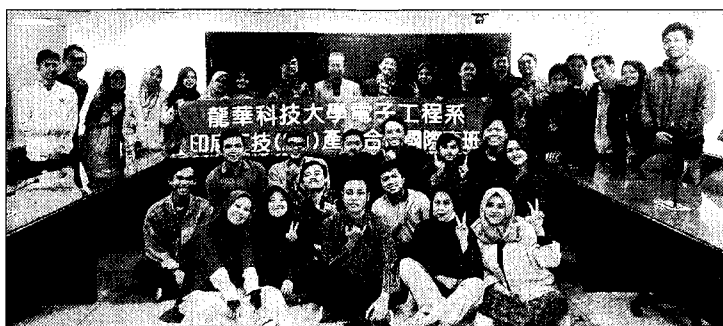
龍華科大開辦「印尼 2+1 技職產學合作專班」，為臺印官方技職教育新合作模式（疫情前照片）。