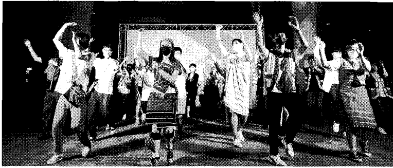
所有師生共同參與大會舞。