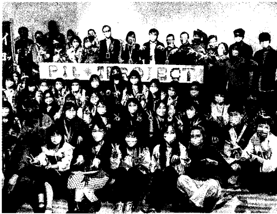
嶺東科大視傳系第22屆畢業製作「泳池潮間」校內展於5月初圓滿落幕。