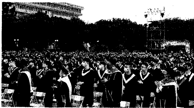
●元智大學夜空下舉行畢業典禮，參與家長及畢業生約1,400人。