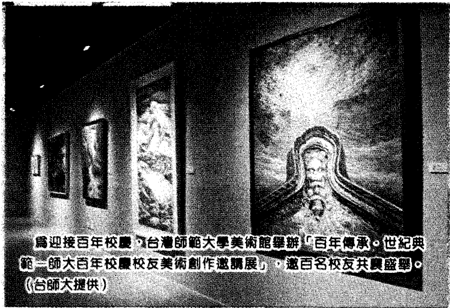
為迎接百年校慶，台灣師範大學美術館舉辦「百年傳承·世紀典範——師大百年校慶校友美術創作邀請展」，邀百名校友共襄盛舉。