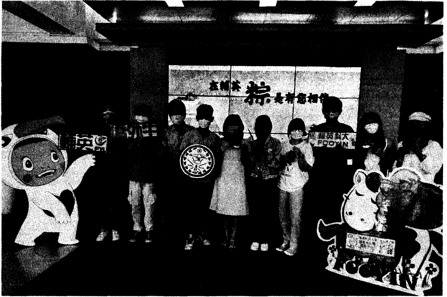
輔英境外生手作虎年香包慶祝端午佳節。