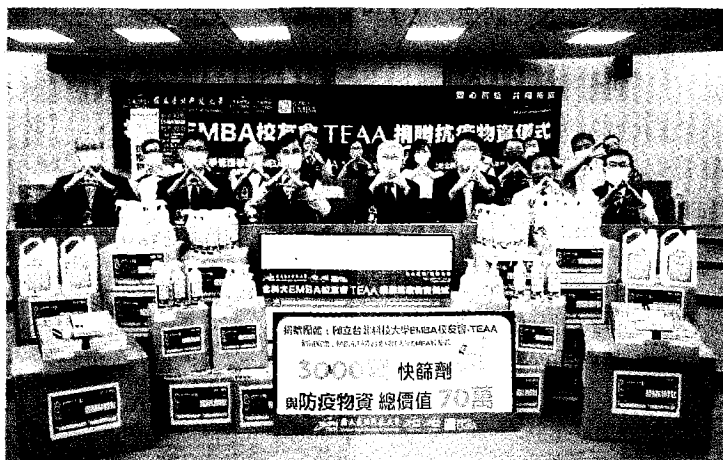
北科大管理學院EMBA校友會、桃園市北科大EMBA校友會等合力捐贈快篩及抗菌噴霧劑等防疫物資給母校。

每人3劑、自主應變每人1劑。另外，也提供東校區宿舍、新北宿舍、南港宿舍管理及總務處清潔人員使用，截至5月底已發放超過1,300劑。