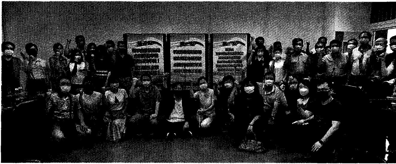
高苑科大教職員工要求教育部應立即依法予以解散董事會。

他強調，高教公共化就是大學民主自治，且校產資源應與社會共享，私立大學不應只是董事會營利的工具。高苑科大全體教職員工主張，嚴正抗拒停招停辦，讓教育事業永續經營，全體學生順利畢業，教職員確保工作權等四大訴求，並認為當前董事會違法亂紀，企圖毀滅學校轉為私人營利用途，教育部應立即依法予以解散。 台灣時報 版