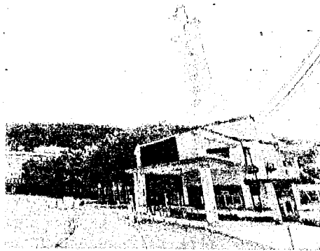
▲教育部證實，蘭陽技術學院將於111學年度起停辦。

課，也可採學籍轉到其他學校，但仍在蘭陽技術學院校園內開班的方式，相關場地費也會由蘭陽吸收。教育部表示，因該校並非專輔學校，將依《私校法》相關規定辦理停辦，停辦後會有3年的改辦或改制期限，之後再由董事會做後續考量。