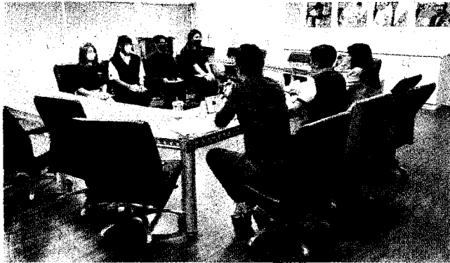
智慧紡織產學菁英專班實習企業媒合率百分百，達成就學即就業。

嶺東科大院長嚴貞表示，將秉持與產業共進發展、共創未來人才的精神，鏈結紡織企業及高中職校與技專校院，以在地產業、在地高職、在地技專校院的精神，攜手共同培育全球化未來人才。（蔣佳璘）