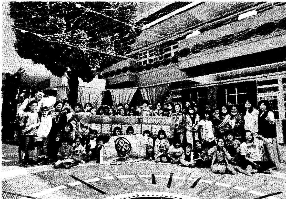
樹德科大兒童與家庭服務系《愛，撒吧！》活動之一。

上、線下資源，將家庭教育的活動推廣到部落家庭的每一個角落。難能可貴的是師生獲得的獎金，挪出部份金額捐贈合作的部落學校，讓愛及正向能量延續，並在部落家庭中漫延開來。 民眾日報 11版