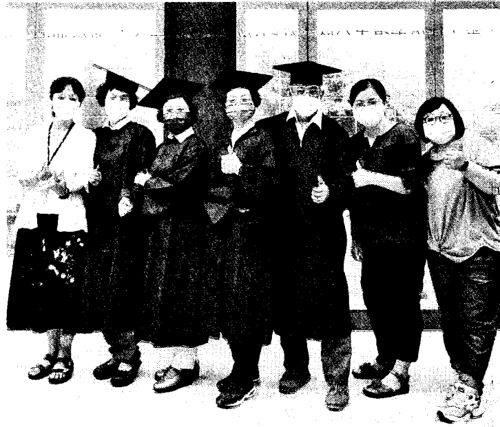
高苑科技大學圖書館四位樂齡志工順利完成學業。