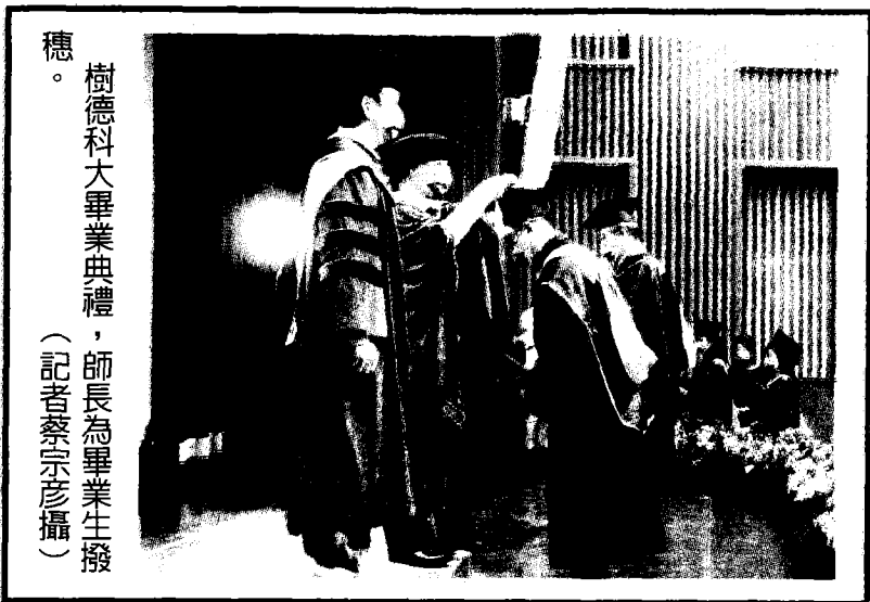
樹德科大畢業典禮，師長為畢業生撥穗。 (記者蔡宗彥攝)