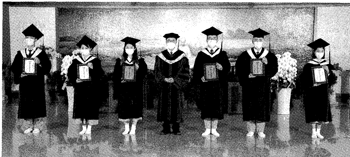
圖：慈大十一日舉行線上直播畢業典，師長為畢業生代表們撥穗、頒發畢業證書、頒獎。

記者張小菁／報導 慈濟大學於十一日舉辦中英文雙語線上畢業典禮，博士班九位、碩士班九十九位、學士班六百八十二位，共計七百九十位。慈大校長劉怡均致詞，這屆畢業生歷經了兩年半的疫情，還有二十一世紀第一場國際戰爭，疫情和戰爭提醒我們生存在這個世界上，沒有人可以自外於病毒所造成的疫病，也沒有人可以自外於戰爭對社會、經濟以及政治所造成的影響。劉怡均校長期許全體畢業生「立足臺灣、庇護天下」，未來在自己的職志生涯開展當中，都能付出自己的專業與時間，與社會大眾能夠合和互協，共同為全體人類的身心健康，以及世界和平而努力。