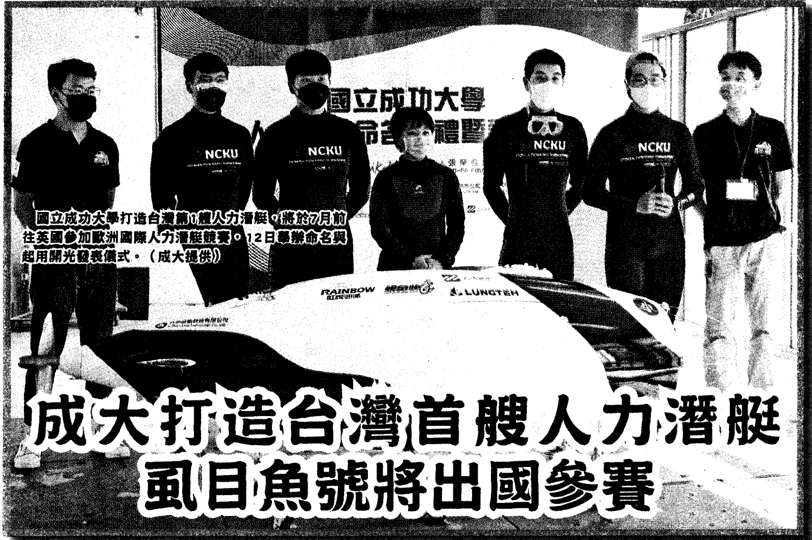
國立成功大學打造台灣首艘人力潛艇，將於7月前往英國參加歐洲國際人力潛艇競賽。12日舉辦命名與起用開光發表儀式。