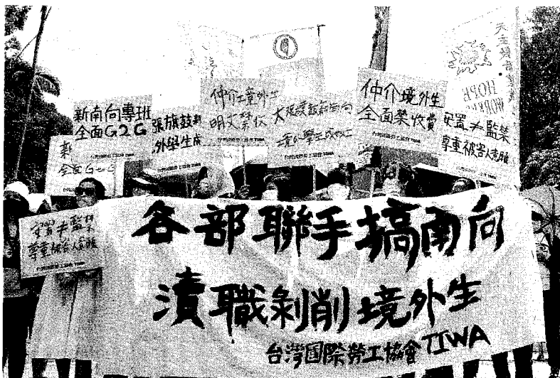
新南向國家境外生來台就學，卻淪為血汗勞工，圖為2019年7月，台灣國際勞工協會於行政院前呼籲，教育部應全面採用政府對政府的方式招收新南向專班學生，杜絕任何仲介行為從中獲利。

教育部招境外生政策有必要調整，應鼓勵國內大學招不用超時打工就能在台灣就學的學生，其中陸生是國內大專校院想要、也有能力招到的。