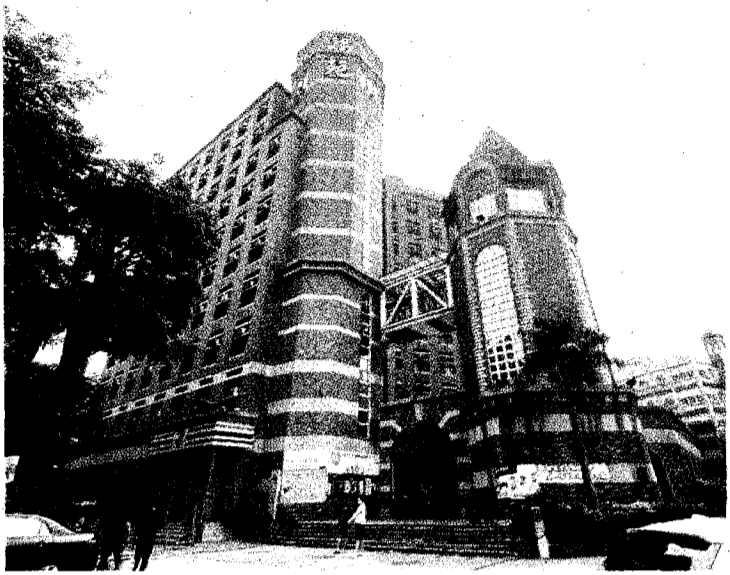
教育部日前函文指出，高苑科大透過人力仲介招生違反規範，已損及學生權益，將列重大行政缺失。