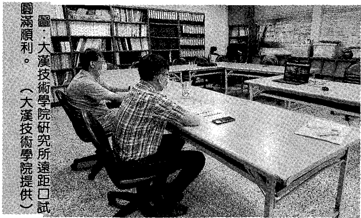
圖：大漢技術學院研究所遠距口試圓滿順利。

大漢技術學院表示，大漢技術學院除研究所，尚有日間部四技休閒遊憩與觀光餐旅管理系，進修部四技有土木工程與環境資源管理系、休閒遊憩與觀光餐旅管理、企業管理管理系、二技企業管理系，假日班二技、二專有土木工程與環境資源管理系、休閒遊憩與觀光餐旅管理系、企業管理系各進修管道，都是進修最好的選擇，報名即日起至八月十六日止，歡迎高中職畢業生及有志進修的青年朋友加入大漢行列，各管道招生專線電話(〇三)八二一〇八一〇洽詢。