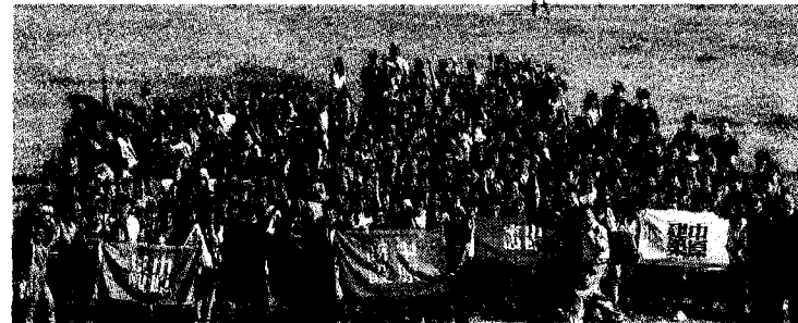
中原大學設計專業教育學院，將與英國牛津布魯克斯大學合作培育人才。