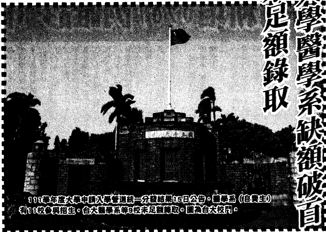
111學年度大學申請入學管道統一分發結果15日公告。醫學系（自費生）有11校參與招生，台大醫學系等9校未足額錄取。圖為台大校門。