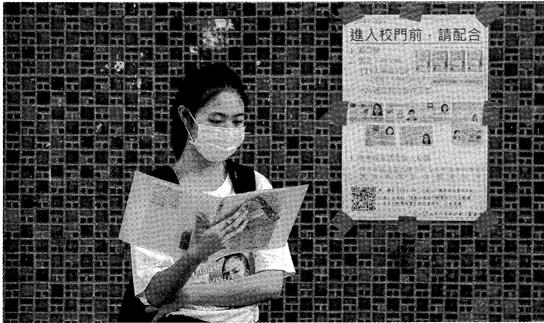
大學甄選入學委員會統計，今年招生缺額計有1萬294個，比去年大增4029個，創近4年新高。

教育部指出：許多考生以防疫外加名額錄取 把這些名額設算回去 缺額狀況與往年差不多