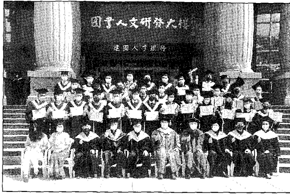
建國科大線上畢業典禮，大部份畢業班仍然以各種方式來慶祝這項人生中重要的儀式。