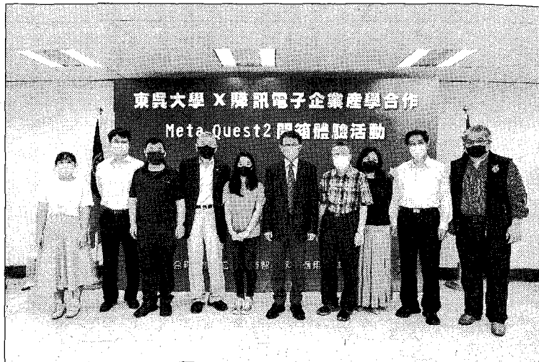
東吳師長及驛訊貴賓合影。