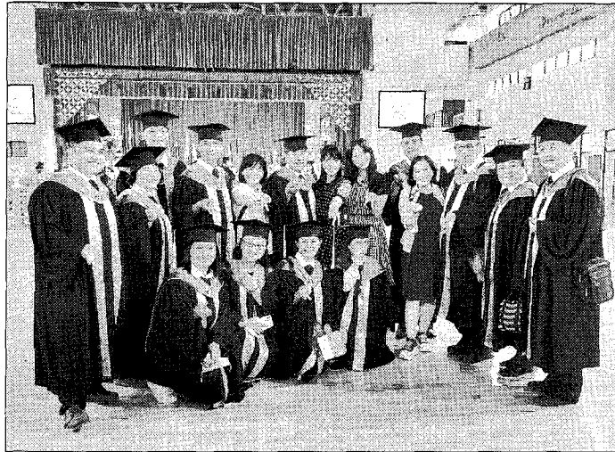
環球科技大學舉辦實體與線上同步「環鷹展翅 樂活職涯」。