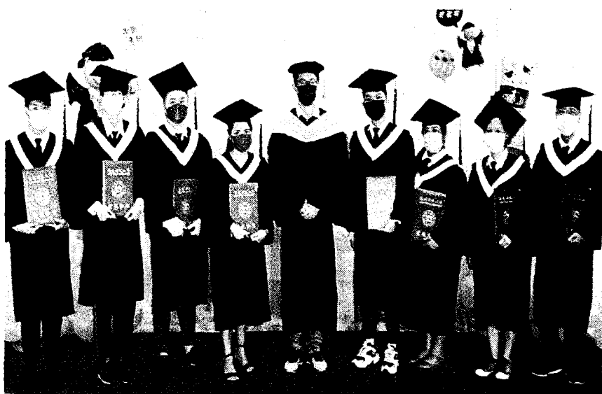
高苑科技大學舉辦111級畢業典禮，採預錄畢業影片線上直播，以及由各系所自辦戶外小規模畢業典禮，為此屆943位畢業生啓航邁向人生下一個篇章。

趙必孝指出，該校這屆畢業生除既有本國籍生外，其中更有近300位來自越南、印尼、菲律賓、馬來西亞等國籍之境外生畢業生，在高苑科大數位領航翱翔國際的年代，輔以政府新南向政策，境外的莘莘學子遠從各地匯聚於南台灣，首選高苑科技大學，而今學有所成，他勉勵畢業生勿忘學校所學、在台積累之豐富工作經驗，繼續精進發光發熱。