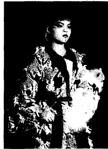
寵物事業管理系畢業公演攜檢定犬在泳池上走秀。