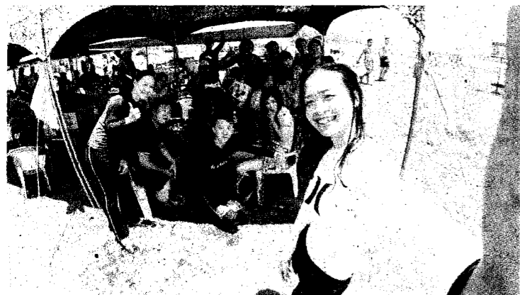
海洋事業學院學生畢業衝浪。