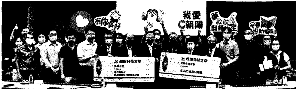
在各界踴躍響應下，4年來朝陽科大補助經濟文化不利學生超過3,800萬元，共計25,677名學子受惠。

透過「夢·啟航·翻轉人生」計畫，朝陽科大全方位幫助經濟不利學生，保障其生活穩定，實踐社會階級的垂流流動。其中，原本因家庭經濟因素考慮休學的蘇姓同學，即是透過此一計畫，得以安心就學，讓他能在全國技能競賽-3D遊戲藝術設計職類獲得佳績，並於畢業前順利就業，成功靠自己的能力翻轉人生。（蔣佳璘）