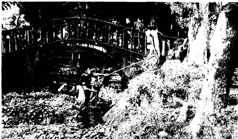
↑崑大環工系連續三年在高中申請入學、日間部、在職碩士班報到率均達百分百。