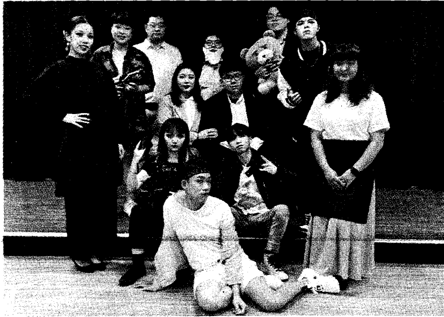
大葉大學英語系歡迎大家上網欣賞畢業公演。