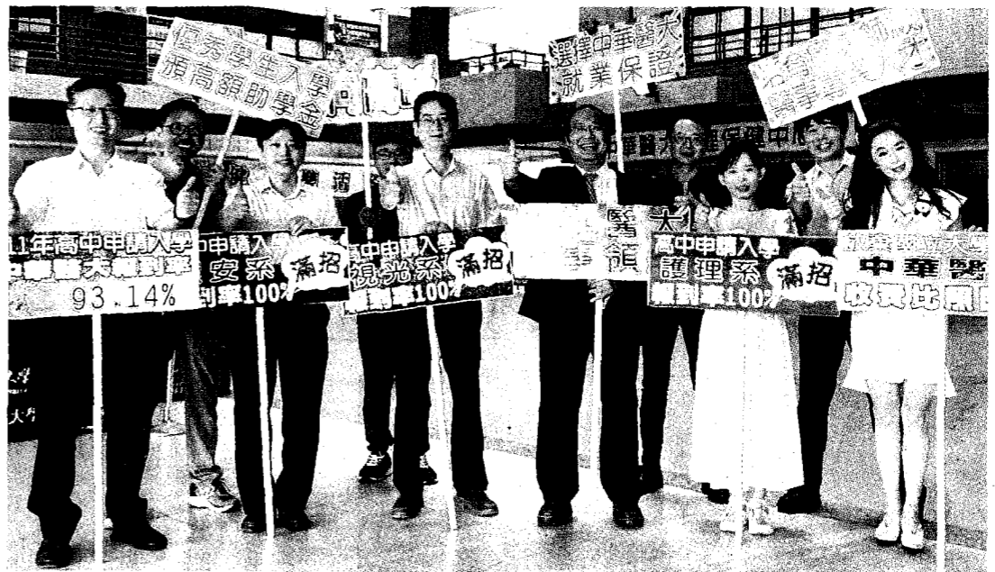
→高中申請入學報到截止，華醫護理系、視光系、環境與安全衛生工程系報到率達百分之百，學校振奮又欣喜。