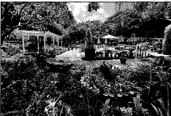
中興大學園藝療育園區昨(25)日開幕。