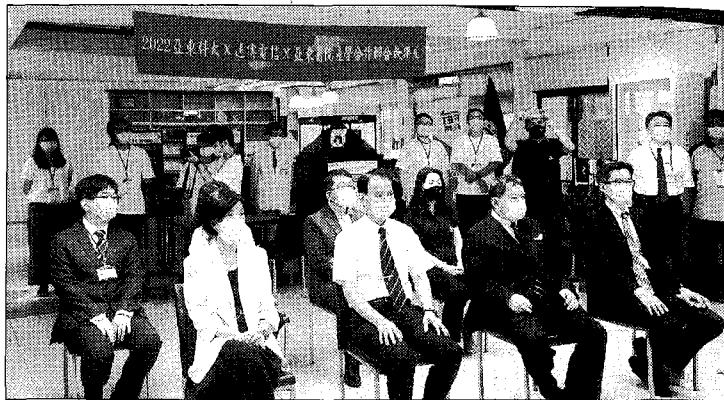
亞東科技大學依循中央流行疫情指揮中心的建議以高規格、低風險的方式辦理畢業典禮。