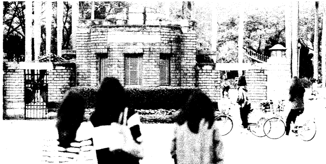
台大校長遴選程序，昨截止推薦收件。