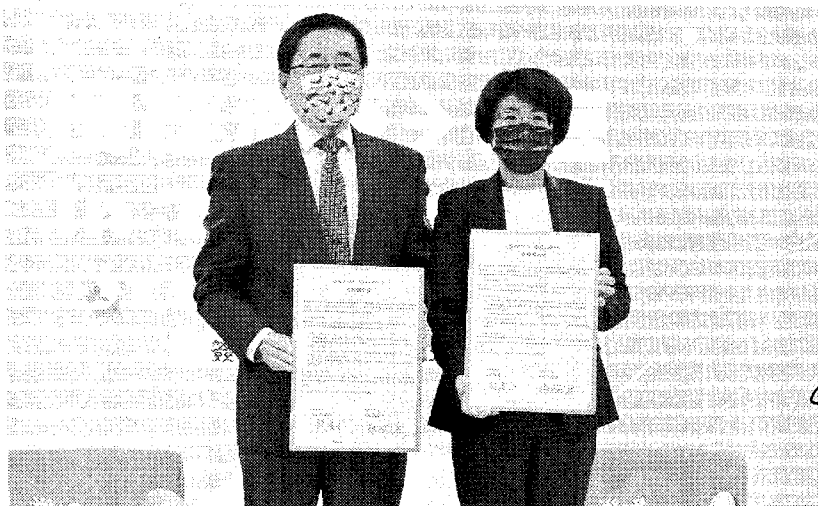
台灣新生報 9 版

【記者鄭沾誠／臺東報導】臺東縣政府為積極推展慢經濟，繼五月與臺東大學簽訂合作備忘錄之後，昨（二十七）日由縣長饒慶鈴與國立東華大學趙涵捷校長共同簽訂官學合作備忘錄（MOU）。（見圖）