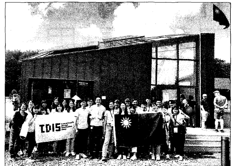
◎陽明交大台灣隊千里遠攜國旗赴德，得獎後開心展旗對全球展示。