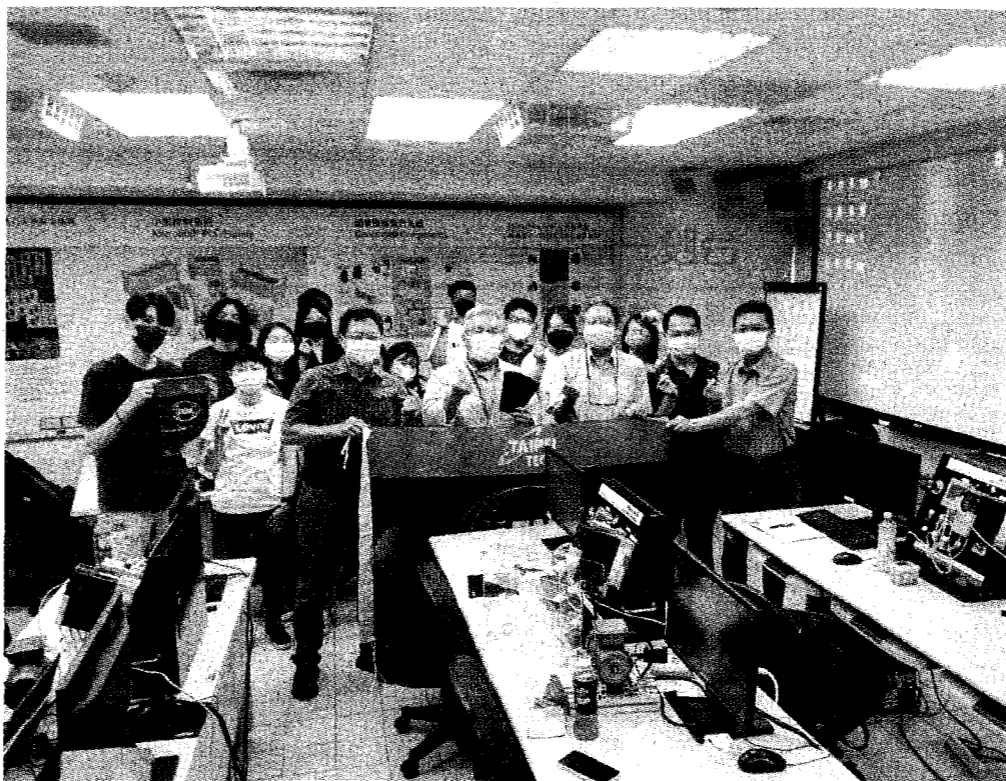
●群崴國際為北科大今年的專題班，特別編列一筆預算，並致贈系所10組馬達及零配件。

群崴國際更希望拋磚引玉，讓更多企業可以一起來參與產學合作，一起培育產業人才，為台灣的自動化產業未來更加蓬勃發展盡一些心力。群崴國際為美商Rockwell Automation台灣區授權經銷商，有相關技術應用問題，歡迎來電洽詢（桃園）03-356-3822，（台中）04-2335-7507，更多資訊請上網 https://www.tran-swell-int.com.tw/ 。