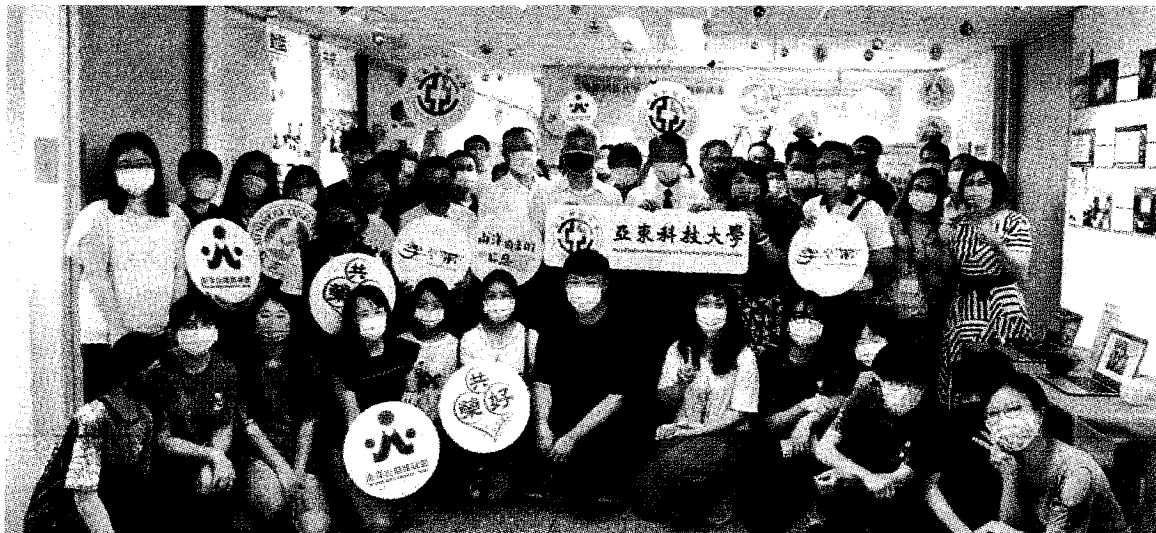
↑亞東科技大學通識教育中心，透過與新住民與學生的生命故事分享與對談，促進多元文化的交流與繁榮。

學通識教育中心以「南洋捎來的訊息」為主題，匯集東南亞各國的文化特色，引導與會者看見與我們共同生活的新住民，並透過與新住民與學生的生命故事分享與對談，深化活動的意義，促進多元文化價值的昂揚。