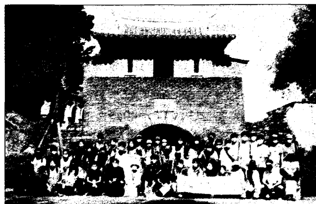
↑成大與清大攜手舉辦「旅溯雙城」跨校課程。(成大文學院提供)