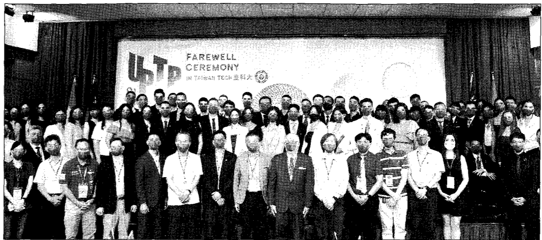
臺巴科大師生大合照。

【記者王志誠、周貞伶／台北報導】臺灣和巴拉圭共同合作在南美洲所建立的第一所高教學府「臺巴科技大學」，首屆九十六位學生，二〇二二年七月完成在臺一年半的交換研習。總統蔡英文、教育部主任秘書廖興國、教育部技職司司長楊玉惠及巴拉圭費卡洛大使於昨（八）日出席在國立臺灣科技大學舉行的「臺巴科技大學—首屆學生結業典禮」，見證國際高等教育