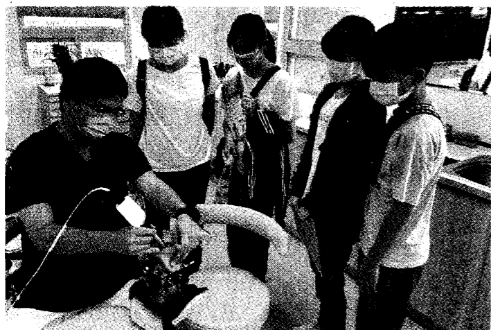
樹人醫專口腔衛生學科導入AR/VR教學。