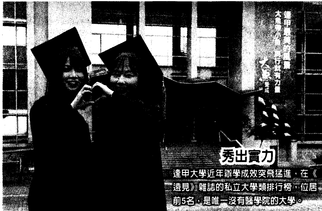
逢甲大學近年辦學成效突飛猛進，在《遠見》雜誌的私立大學類排行榜，位居前5名，是唯一沒有醫學院的大學。

今明兩天是大學分科測驗，大考報考人數逐年減少，國內大學在全球化競爭及少子女化態勢下，發展陷入M型化。為推動社會進步，《遠見》每年進行「台灣最佳大學排行榜」調查，揭示各大學為異軍突起，不只拚排名，更力拚發展特色。