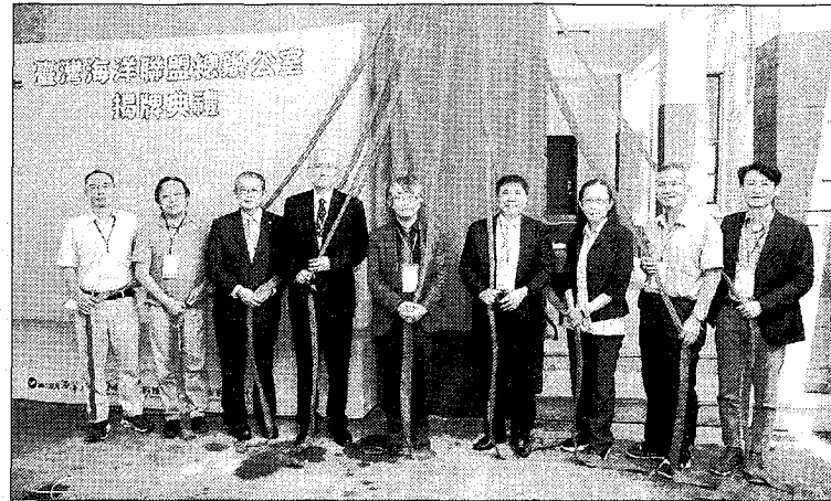
臺灣海洋聯盟揭牌，海大召集學研專家打造海洋永續基石。

聯合國將2021至2030年訂為「海洋科學永續發展十年」，臺灣以海洋立國，發展國家海洋政策並扣合永續發展為重點推動計畫，2021年10月即籌組臺灣海洋聯盟，並策略共識「持續完善海洋基礎調查」、「躍升海洋關鍵科技設施」及「跨域整合海洋永續研究」等三大面向。