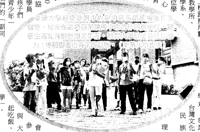
學系、台灣 台灣文化 民族 理

顧瑜君指出，社會參與中心是把大學當成社會責任的實踐場所，透過大學課程中與社區、地方組織建立連結，發展出多元陪伴教育生態網，培育大學生成為有社會實踐能力的行動者，陪伴不同生命處境的受照顧者，落實高等教育課程的社會責任。