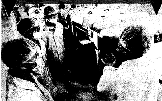
龍華科大設置2座類產業環境實作基地，培訓學子成為業界搶手人才。