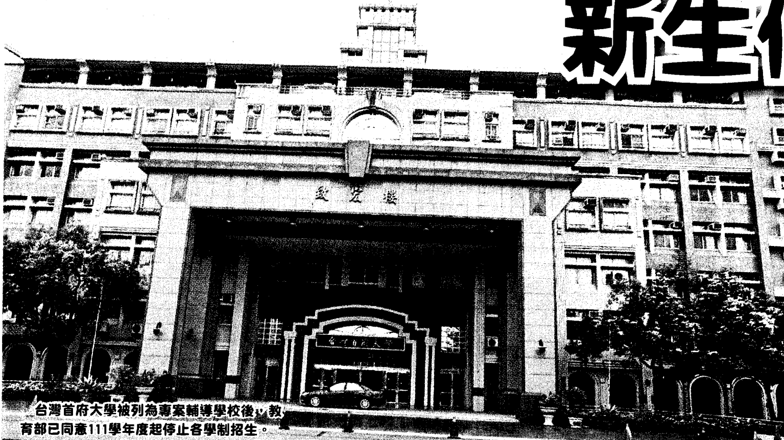
台灣首府大學被列為專案輔導學校後，教育部已同意111學年度起停止各學制招生。

【台南訊】台灣首府大學被列為專案輔導學校後，教育部已同意112學年度起停止各學制招生，校方預計11月底舉辦學生安置分發說明會，將先輔導已招收的大一、碩一新生轉到其他學校就讀。 教育部近期發函給台灣首府大學（台首大）指出，董事會5月決議朝「先停招、再停辦」方向規劃，教育部經諮詢私校諮詢會，決定自112學年度起停止台首大各學制全部班級招生，校方預計於11月底舉辦學生安置分發說明會。 校方人員指出，先前曾向南部地區約100多間大學學院徵詢協助安置學生就學事宜，待教育部確定協助安置學校名單後，校方會調查學生意願，輔導轉至其他學校就讀，將優先輔導已招收的大一、碩一新生約300多人，台首大目前有約400多名學生。其他學生若有意提前接受安置分發，校方也會提供協助。 眾聲日報 8月