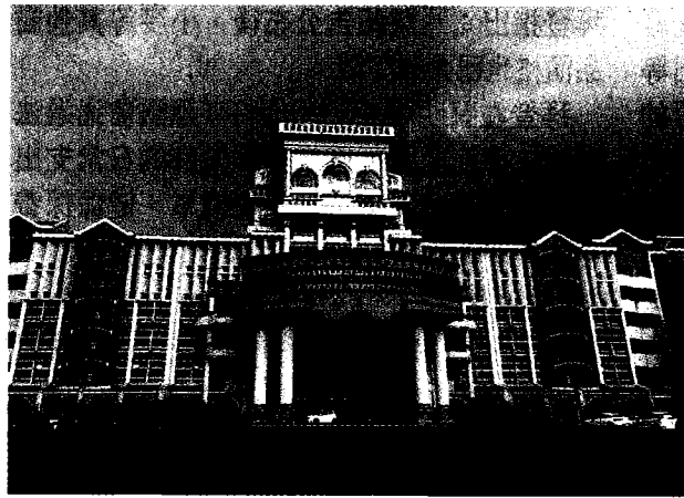
台灣首府大學將於111學年起全面停招，將逐步安置學生。 圖／資料照片

【本報台北訊】位於台南的台灣首府大學於今年五月宣布先停招、再停辦，引起校內師生譁然。教育部昨日證實，台首大董事會未於期限內捐資，經過教育部實地查核後，認定學校已無法維持教育品質，因此依照私校法第五十五條命學校一一學年起全面停招，但為維護學生受教權，若學生希望安置到其他學校，教育部將給予協助。此外，教育部也核定二〇一九年決定停招的嘉義縣民雄鄉協志工商，自一一學年度起停辦。