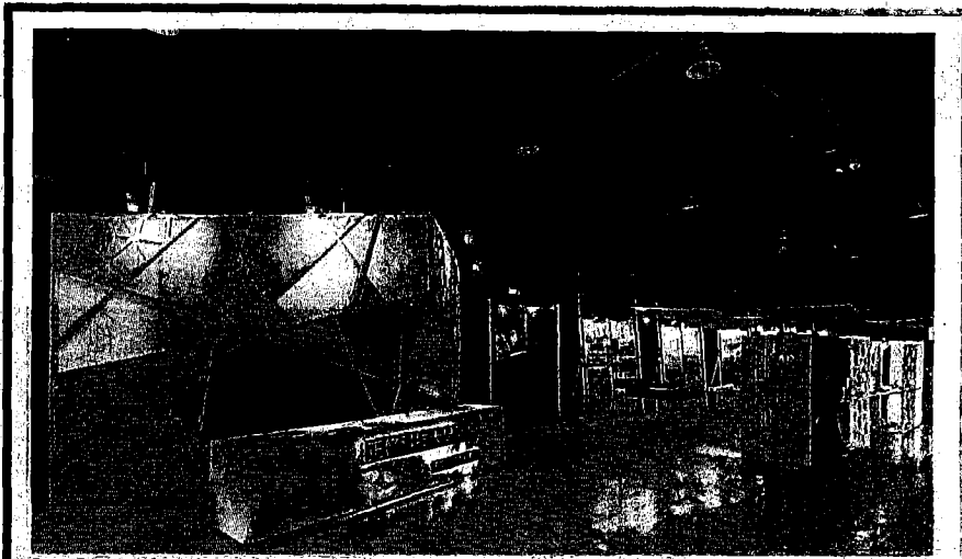
正修科大建築系上培育出的數位設計人才，每年在駁二舉辦的青春設計節。