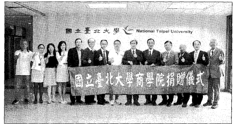
捐贈人與校方合影。