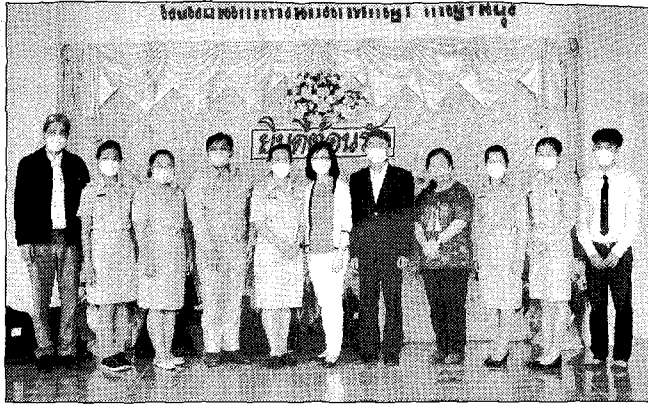
台灣龍華科技大學赴泰拓展新南向政策海外教育，培育優質實務人才。