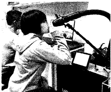
陽明交通大學運用深耕計畫經費購置可用於分析氣體樣品，協助人體呼氣氣體分子濃度測定領域發展之「選擇離子流動質譜儀」。

清華大學研發長曾繁根表示，清大年度僅獲十二億元，與東南亞較好的大學相比只有三分之一到五分之一。經費也反映到人員補助，如鄰國給博士生一個月六萬元補助，台灣約一到三萬元，建議未來少子化學校退場，應讓高教深耕資源慢慢集中