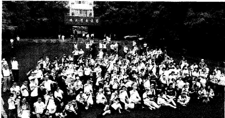
圖：宜蘭縣頭城鎮蘭陽技術學院8月1日起停辦，200多名校友31日穿起復刻版制服返校巡禮，重溫當年回憶，並一同唱校歌，向學校道別。

蘭陽技術學院位於宜蘭縣頭城鎮，根據學校網站，學校於1965年9月1日奉准籌辦，定名為「復興工業專科學校」；1983年更名為「復興工商專科學校」，2001年8月1日改制為「蘭陽技術學院」，並附設專科部。