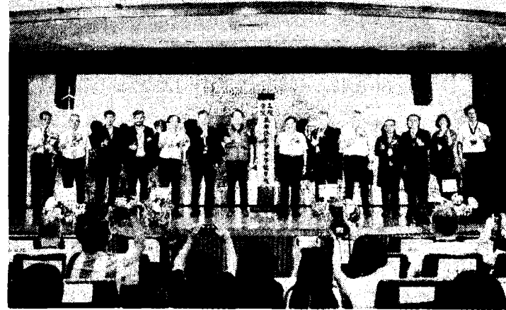
明新科技大學設立全國第一個「風力發電學士學位學程」「風電產業人才培育聯盟」也同時成立。