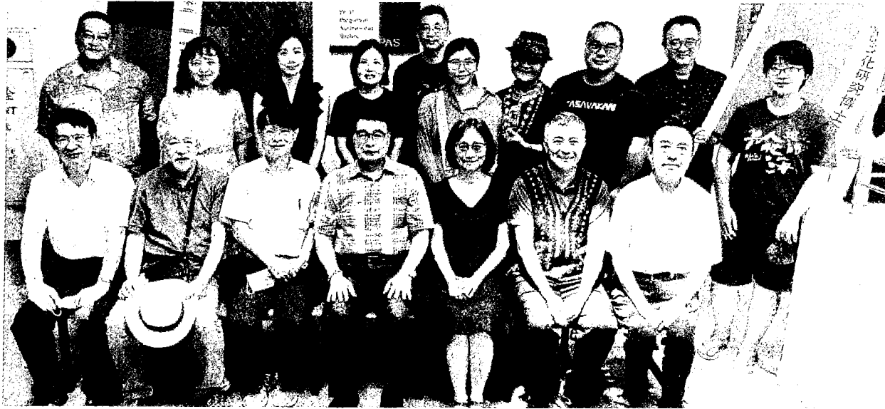
圖：臺東大學南島文化博士班揭牌儀式，會後大合照。