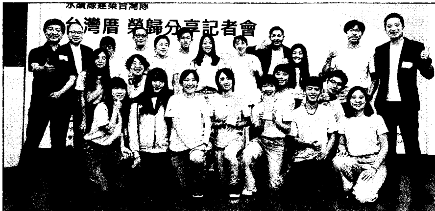
陽明交通大學跨領域設計科學研究中心「台灣厝」團隊榮耀返台。