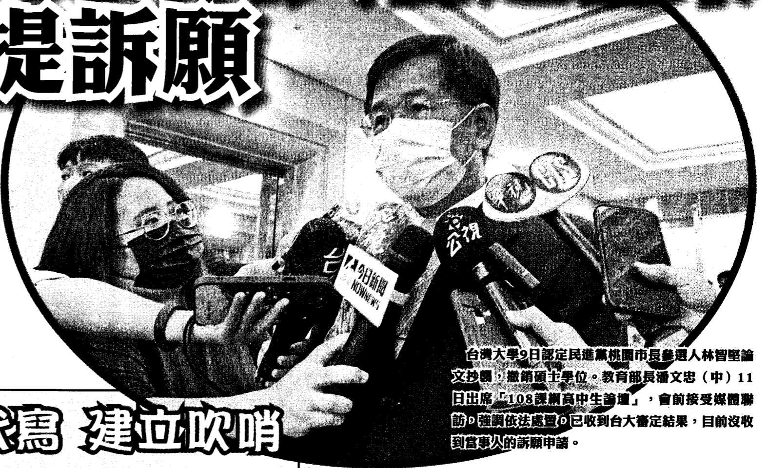
台灣大學9日認定民進黨桃園市長參選人林智堅論文抄襲，撤銷碩士學位。教育部長潘文忠（中）11日出席「108課綱高中生論壇」，會前接受媒體聯訪，強調依法處置。已收到台大審定結果，目前沒收到當事人的訴願申請。

【台北訊】台大9日認定民進黨桃園市長參選人林智堅論文抄襲，撤銷碩士學位。教育部長潘文忠強調依法處置，已收到台大審定結果，目前沒收到當事人的訴願申請。