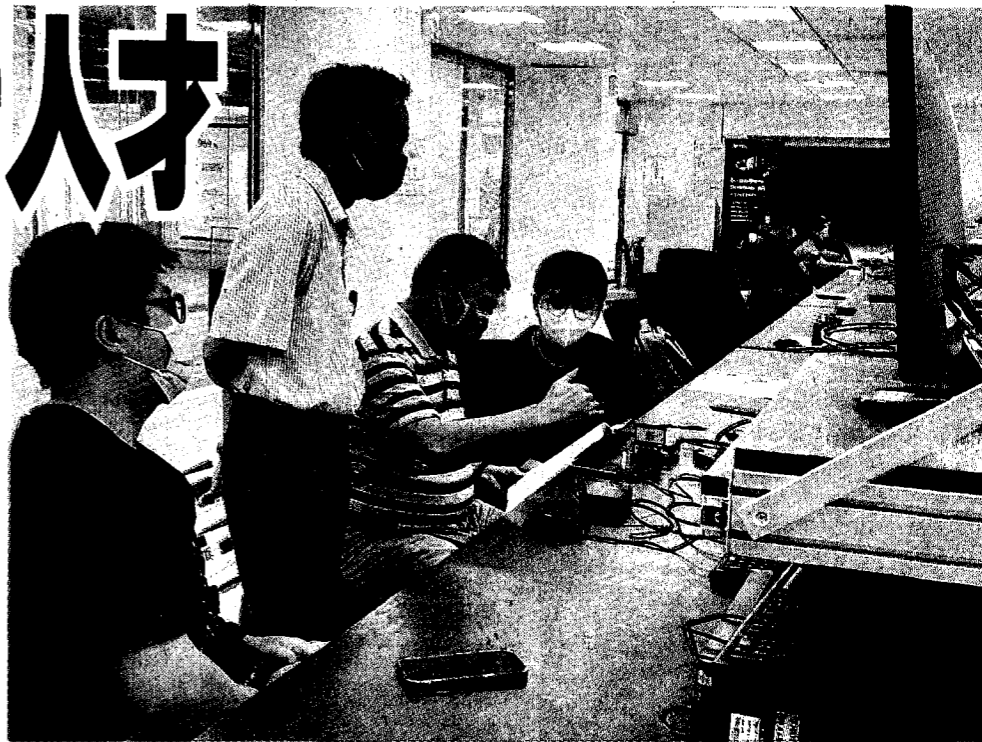
龍華科大5G毫米波技術應用實務人才研習課程，由業界講師指導學員實作。