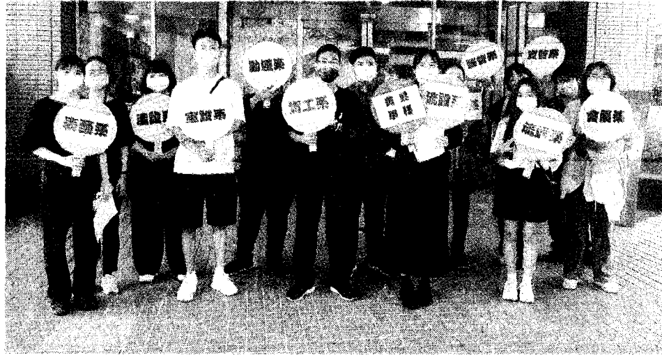
圖書館前各系學長姐等候帶隊導覽。

【記者宋正忠高雄報導】樹德科大學務處昨日舉辦「新生聯合服務暨各系說明會」，讓准樹德人及家長都能藉機認識校園、教學選課、學雜費、就學貸款、交通運輸、各項入學獎學金發放作業、新生健檢、資源教室、特色社團、及