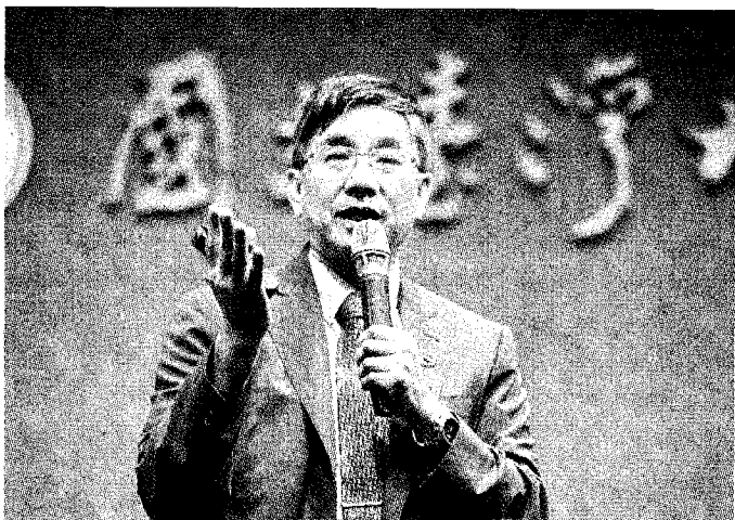
台大校長候選人楊志新教授說明治校理念。