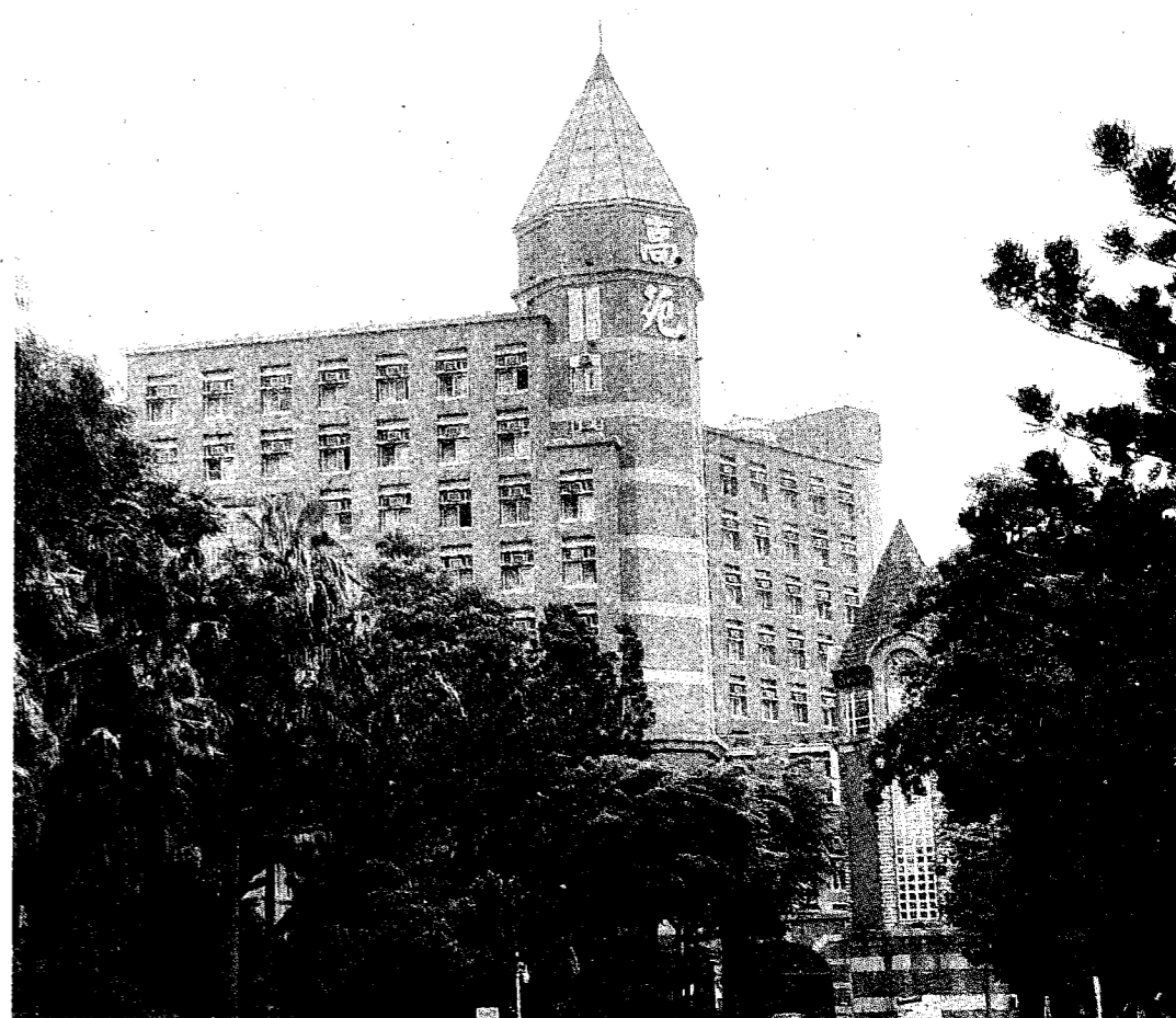
高苑科技大學董事會發布代理校長卻未報教育部核准其正當性被質疑。

基於以上三點理由，該自救會主張董事會對張中將聘任為代理校長為無效之命令，因此籲請教育部依私校法第54條規定「私立學校因人事或財務等違法而發生重大糾紛，致嚴重影響學校正常運作且情勢急迫者，學校主管機關得逕行停止校長及有關人員職務，並指派適當人員暫代其職務」，由教育部指派代理校長暫時綜理校務，或是由該校校務會議經會議後推舉適當人選為代理校長。