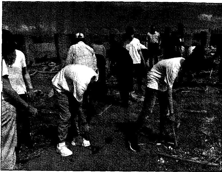
國立高雄大學、高雄市立新莊高中兩校師生日前前往援中港濕地公園、出海口沙灘整理環境，清出大批日常垃圾及海廢。

〔記者呂佩琍高雄報導〕國立高雄大學、高雄市立新莊高中兩校師生日前前往援中港濕地公園、出海口沙灘整理環境，清出大批日常垃圾及海廢，除深刻體認海洋廢、陸蟹棲地遭受人為破壞之嚴重性，以實際行動響應「SDGs（聯合國永續發展目標）」。