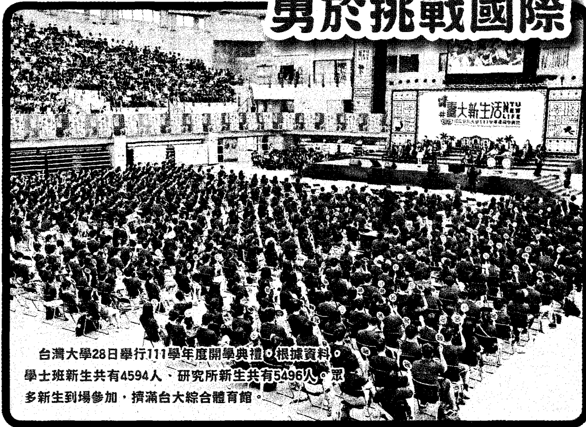
台灣大學28日舉行111學年度開學典禮。根據資料，學士班新生共有4594人、研究所新生共有5496人。眾多新生到場參加，擠滿台大綜合體育館。

【台北訊】台灣大學昨天舉行開學典禮，校長管中閔致詞時表示，今年入校的大一新生，高中時期幾乎被疫情籠罩，如今校園生活終於可以回歸常態，期許新生勇於挑戰國際，走出疫情陰霾。 台大舉行111學年度開學典禮，根據資料，111學年度學士班新生4594人、研究所新生5496人。今年的典禮不但恢復辦理實體典禮，也嘗試打破以往的制式作法，以「你認識的台大？」、「聊聊台大吧！」及「新生活大哉問」等座談和互動的方式替代傳統的致詞與奏樂。 直到接近典禮尾聲才換到管中閔上台致