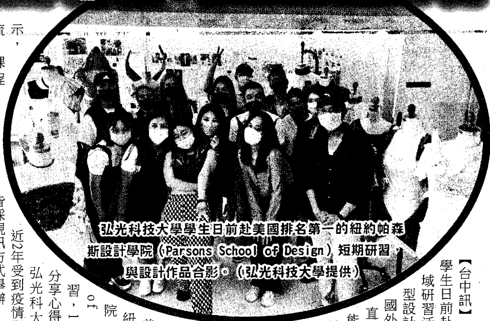
弘光科技大學學生日前赴美國排名第一的紐約帕森斯設計學院 (Parsons School of Design) 短期研習，與設計作品合影。

【台中訊】弘光科技大學二名學生日前赴美參與13天的跨域研習活動，學習時尚造型設計，返國後，分享國外研習經驗，學生直呼「把握機會，才能累積自己的國際競爭力」。