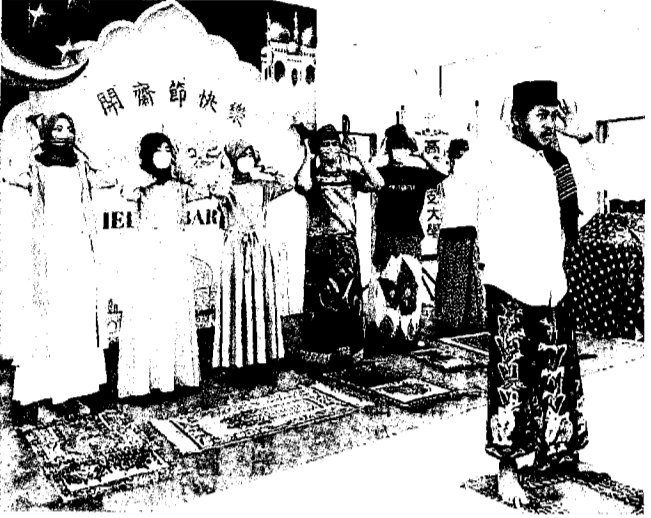
私立大專校院透過新南向專班招收許多境外生。圖為學校為身處異鄉的穆斯林學生舉辦開齋節活動。

教育部自一〇六年起推動「新南向產學合作國際專班」，鼓勵大專校院招收印尼、菲律賓、泰國、馬來西亞等東南亞國家的學生來臺就讀。根據教育部統計，一一〇學年度全臺有六萬四千四百多名境外學位生，是十年前的二點五六倍，其中私校人數