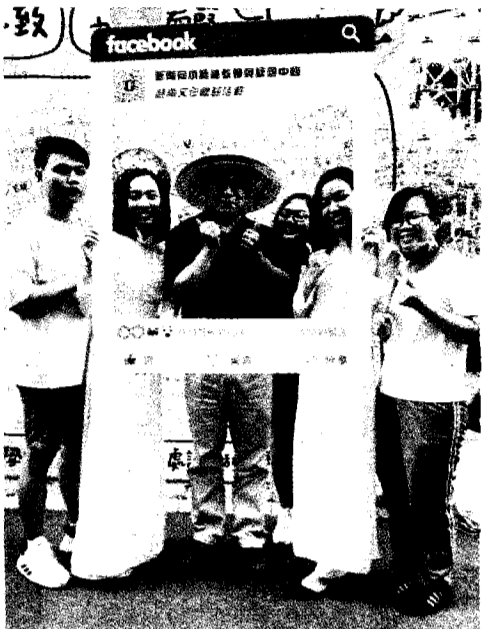
▲為了幫助境外生融入臺灣的生活，致理科大舉辦越南文化體驗活動。