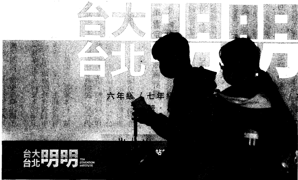
台灣大學告台大文理短期補習班侵權，近日一審判決出爐，台大勝訴。目前業者招牌已改為台大明明。

台大說，台大品牌是師生長年經營的心血，校徽、名稱不是公共財，不得讓私人企業以此盈利，使用台大商標需循管道取得授權，台大已收到業者的聲明上訴狀。本報聯繫業者，但業者婉拒未對一審結果進一步回應。 台大法務處執行長、訴訟代理人陳琬渝說，台大自民國七十一年陸續註冊多