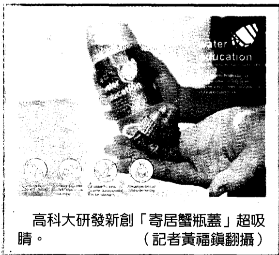
高科大研發新創「寄居蟹瓶蓋」超吸睛。