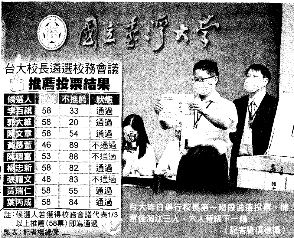
台大校長遴選校務會議 推薦投票結果