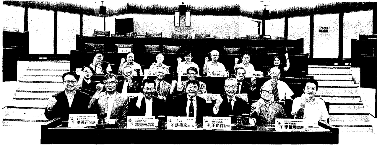
→ 國立台灣海洋大學遴選出二一年度十位傑出校友。