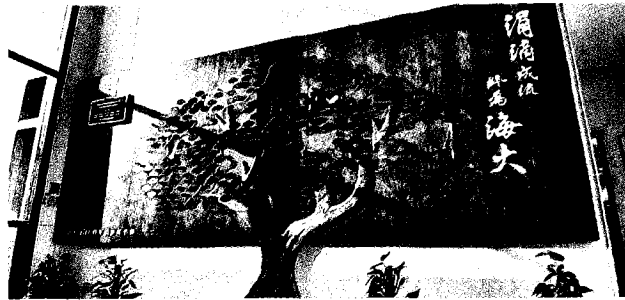
國立臺灣海洋大學是兼具卓越教學與特色研究的國際頂尖大學，校友遍布全世界。

業學系）、沛華集團營運長汪秋月（75級航運管理學系）、聯興國際物流公司資深副總洪禎陽（99級航運管理學系碩士在職專班航運管理組）、美富工業公司總經理陳昭男（76級水製食品科學系）、國立花蓮高工校長黃鴻穎（91級機械與輪機工程學系研究所／101級機械與輪機工程學系博士）、光隆實業公司董事長詹賀博（88級機械與輪機工程學系）、展昭國際企業公司總經理林茂廷（61級河海工程學系）以及美德耐公司董事長賴調元（72級輪機工程學系）。 （楊鎮州）