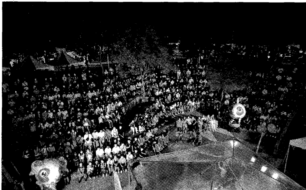
圖：東華大學——學年新生入學活動-社團博覽會，展現魅力四射的社團活力。

這次活動共有二十場次精彩動態表演，各社團都端出十八般武藝，吸引眾人的目光，希望新生們都能加入有興趣的社團，能讓精彩的社團活動豐富新生們嶄新的大學生活。