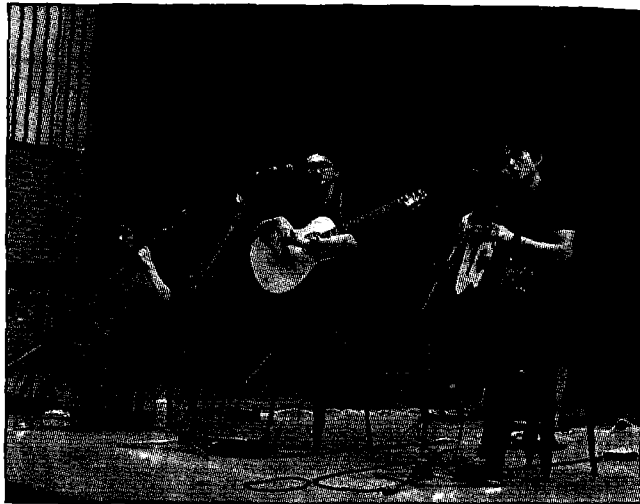
高雄大學「卓越講座」邀請玫瑰墓樂團到校演出。