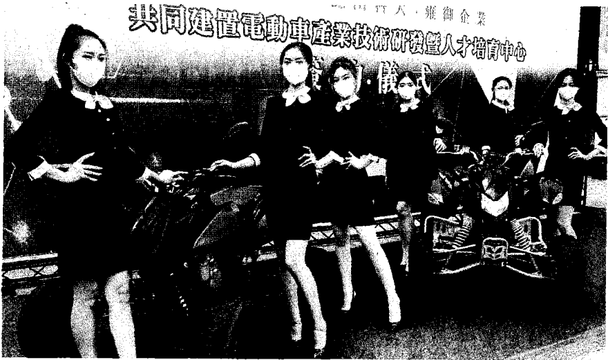
→崑大時尚學生擔任時尚車模吸引眾人目光。