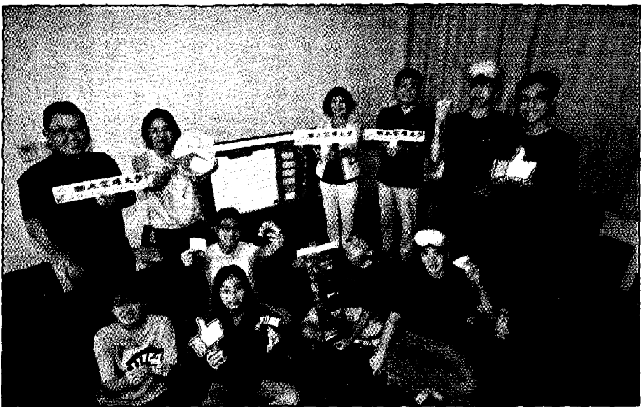
高雄大學「不義遺址的人權與法制省思」遊戲式學習課程，由高雄大學、監察院國家人權委員會、網路學習平台PaGamO共同開發完成，探究一九四九年爆發的海軍白色恐怖案。

高大團隊日前線上視訊舉辦課程說明會，吸引全台高中職師生、國際特赦組織台灣分會熱烈參與；遊戲同步於PaGamO平台「高中職世界」上架公測至十一月底。團隊也與國教端夥伴合作、辦理人權VR影像暨桌遊體驗，在十月廿八至三十日於左營新光三越十一樓文化會館展出，歡迎有興趣民眾報名體驗。