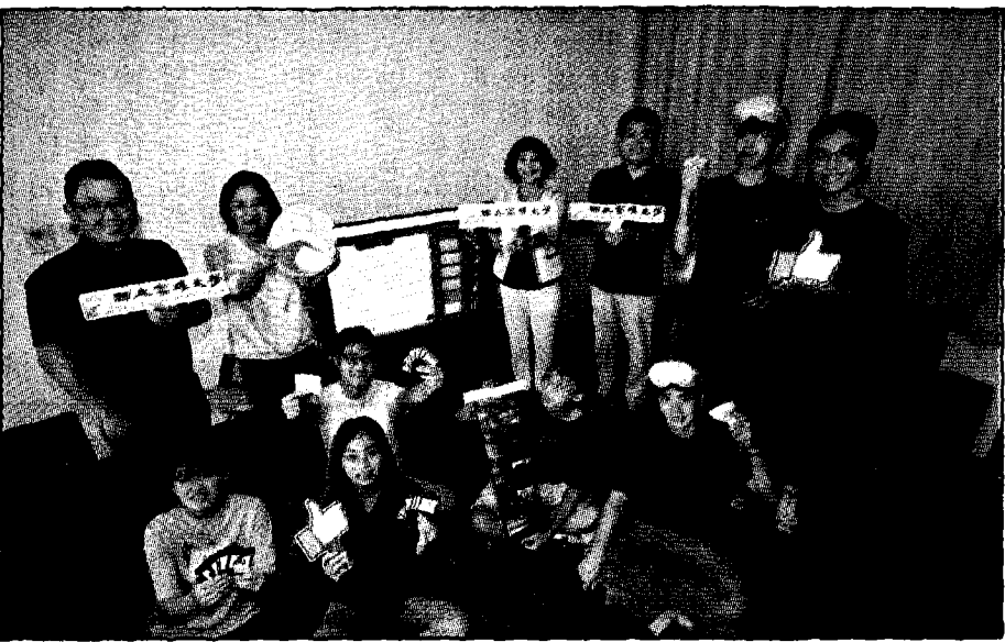
高雄大學「不義遺址的人權與法制省思」遊戲式學習課程，由高雄大學、監察院國家人權委員會、網路學習平台PaGamO共同開發完成，探究一九四九年爆發的海軍白色恐怖案。

高大團隊日前線上視訊舉辦課程說明會，吸引全台高中職師生、國際特赦組織台灣分會熱烈參與；遊戲同步於PaGamO平台「高中職世界」上架公測至十一月底。團隊也與國教端夥伴合作、辦理人權VR影像暨桌遊體驗，在十月廿八至三十日於左營新光三越十一樓文化會館展出，歡迎有興趣民眾報名體驗。