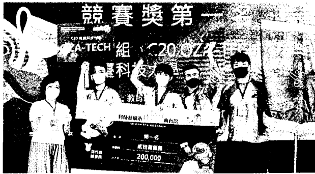
南臺科大OZA-TECH學生團隊在飛行組奪金。