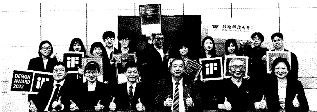
●致理科技大學榮獲2022四項德國iF設計大獎肯定。

隨著科技無遠弗屆的發展與應用，且為提升中高階人才管理知識，該校設立「智慧商務與創新研究所」，將從112學年度起開始招生，提升學生整合金融、行銷、會計和管理等專業知識，及運用新興科技的能力，加上該校原有之服務業經營管理研究所與國際經營與數位貿易研究所，滿足社會培育優質人才的需求。