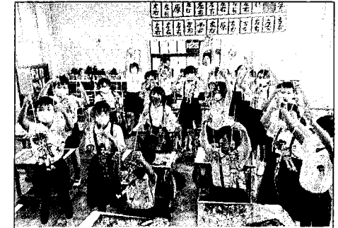
東華皮影戲團演出「西遊記」，讓日本學生直呼：「好精采！」（義守大學提供）