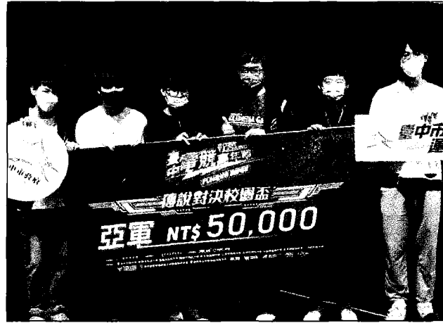
↑僑光科大電競黑鯊隊，榮獲二〇二二台中電競嘉年華亞軍。