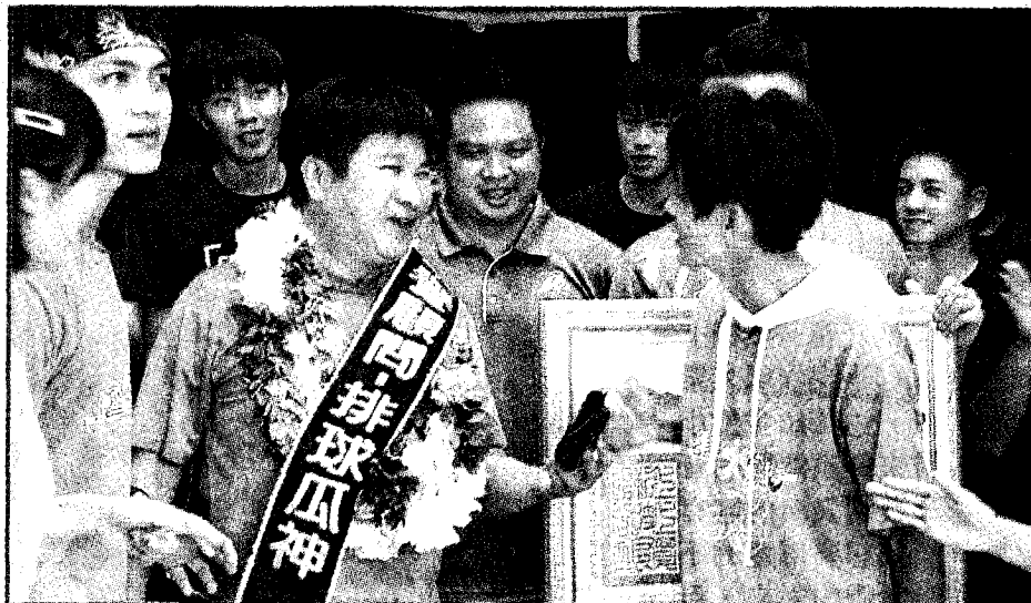
◉經胡瓜（左三）加持幫助後，中原大學排球校隊拿下全國冠軍。