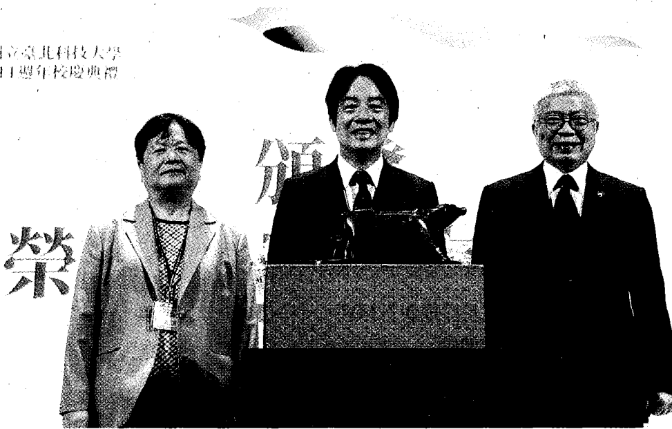
●北科大校長王錫福（右）、校友會全國總會總會長張水美（左）共同敬贈副總統賴清德（中）臺灣水牛銅像雕塑。