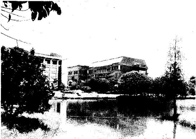
▲少子化對私立大專校院的衝擊大，同列專案輔導學校的明道大學積極走出自我特色，希望力挽狂瀾。

為了避免招生不足而面臨退場，位在新北市石碇的華梵大學率全國之先，推出一「新生只要修習「校園共同維運實習課程」，就可獲得與學雜費同額的「品德獎學金」五萬四千元，幾乎等於