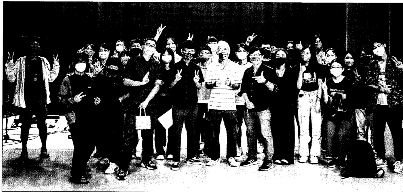
↑崑大視訊系開辦流行音樂學程培育新「聲」代，授課講師包括廿五名金獎師資，老將新秀齊聚堪稱史上最強大影視聲音課程。