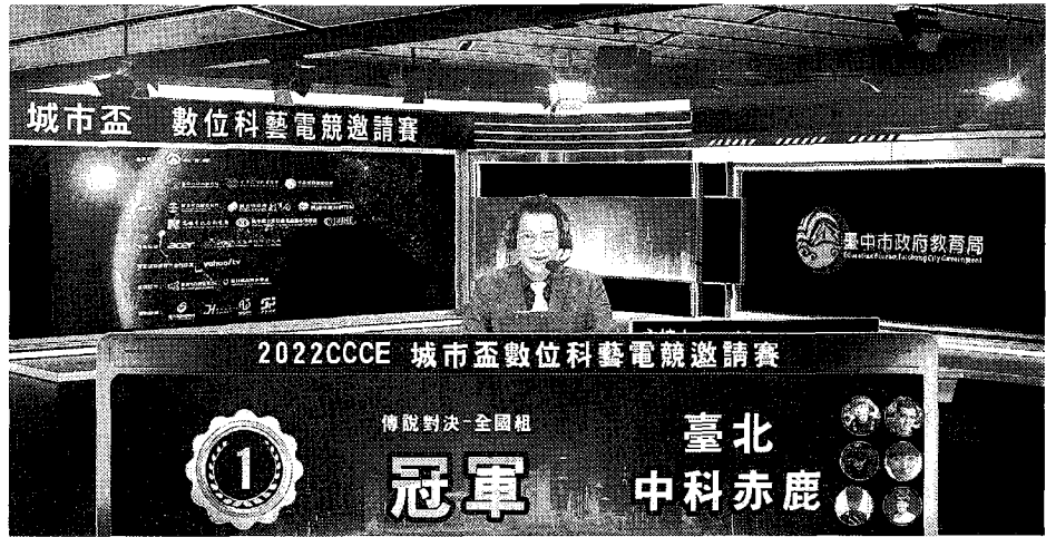
中國科技大學學生團隊榮獲《傳說對決》全國總冠軍。

【記者王志誠、周貞伶／台北報導】二〇二二年「第四屆CCCE城市盃數位科藝電競邀請賽」在長達四個月的熱烈激戰後，中國科技大學學生團隊作品《傳說對決》榮獲全國總冠軍、《商品設計》亞軍、《造型設計Vtuber》亞軍與季軍四項殊榮。