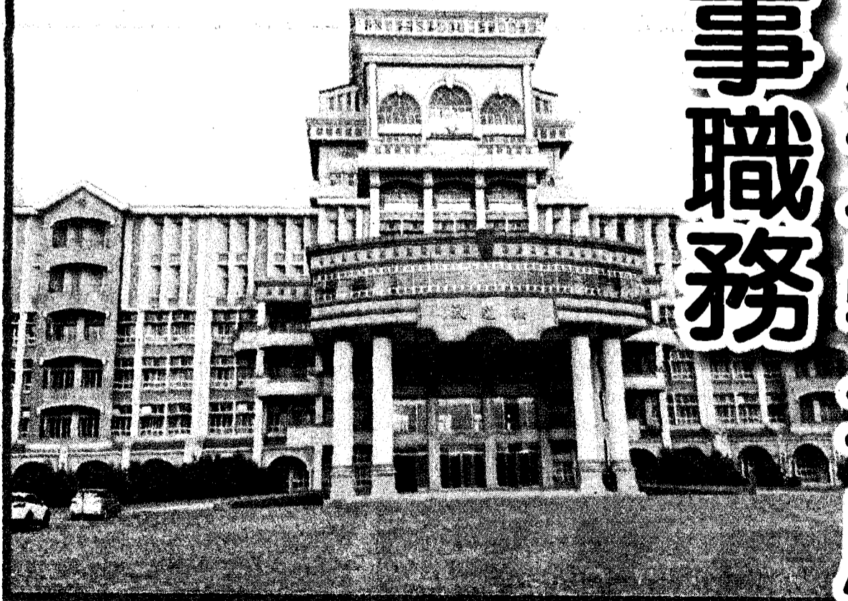
教育部17日召開退場審議會，之前已列專輔的中州科大、台灣首府大學（圖），因校方主動申請停止全部招生。

校，而兩校主動申請停止全部招生。教育部表示，分別於10月31日核定中州科大、11月2日核定台首大自112學年度起停止全部招生，並將於112學年度結束時停辦。教育部依照「退場條例」第17條及相關子法規，後將解除兩校法人全體董事職務，並派任經退審會昨天審議同意的董事會成員。