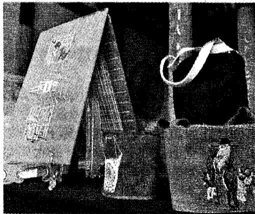
南應大刺繡中心於古蹟陳德聚堂舉辦刺繡成果展！

主題三：推廣刺繡善盡大學社會責任，為推廣刺繡善盡大學社會責任，學生以「知福、惜福、再造福」為主題，用一針一線的刺繡散佈給更多人，背後故事更是以孝順不能等、孝要及時及尊師重道為發想，將這份善與愛傳遞給更多人。 台灣時報 19 版