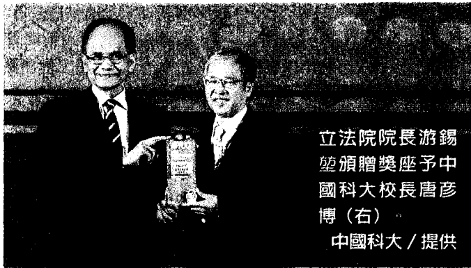
立法院院長游錫堃頒贈獎座予中國科大校長唐彥博（右）