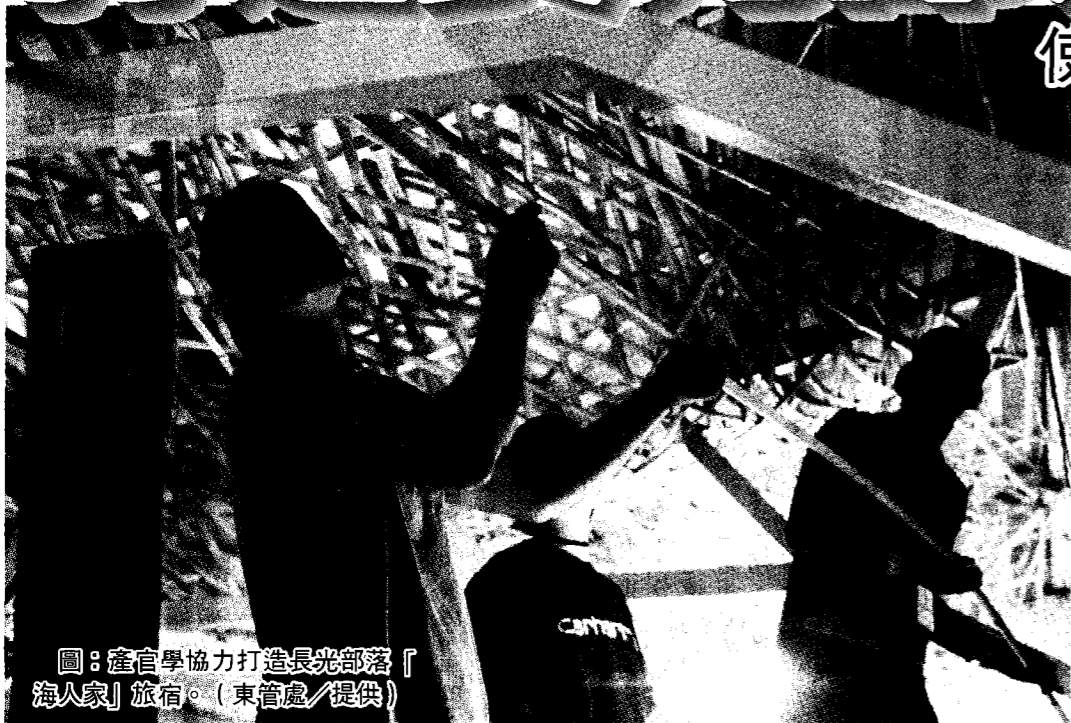
圖：產官學協力打造長光部落「海人家」旅宿。

東管處表示，四處空間改造據點預計於一二年三月底前改造完工，歡迎民衆造訪東海岸時，特別前往改造據點預約體驗山海遊程，感受東海岸部落的熱情與深度遊程魅力。 更生日報 3 版