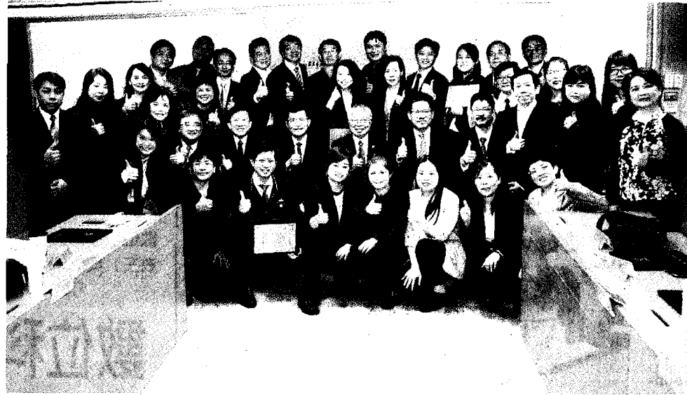
▲北科大、聯輔基金會合作「高階財務管理人才聯合培育計畫」結業證書頒發儀式，出席貴賓合影。

北科大校長王錫福表示，該計畫是國內教育與經濟跨域結合的創舉，運用北科大EMBA優質師資與環境，結合聯輔基金會豐富的訓練資源與經驗，為EMBA加值。北科大一百多年來作育無數