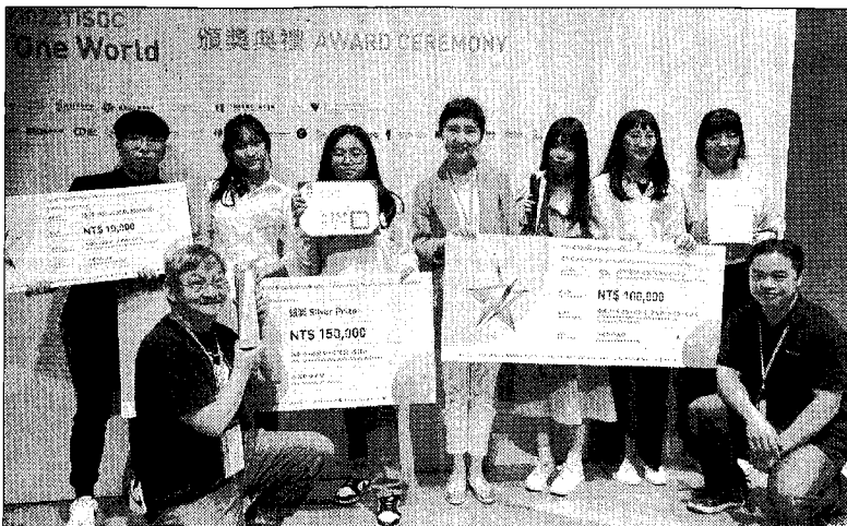
中國科大視傳系獲獎同學與指導老師們合照。