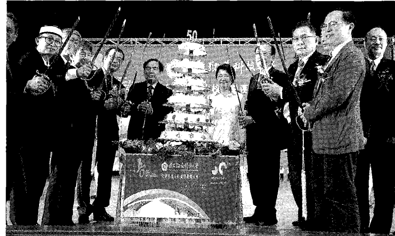
盧市長出席國立勤益科技大學50周年校慶。

教育局指出，國立勤益科技大學辦學有成，積極拓展國際學術合作，泰晤士高等教育（THE）排名躍升國立科大第4名、《天下Cheers雜誌》及《遠見雜誌》發佈「台灣最佳大學排行榜」，位居全台灣國立科大第4名。