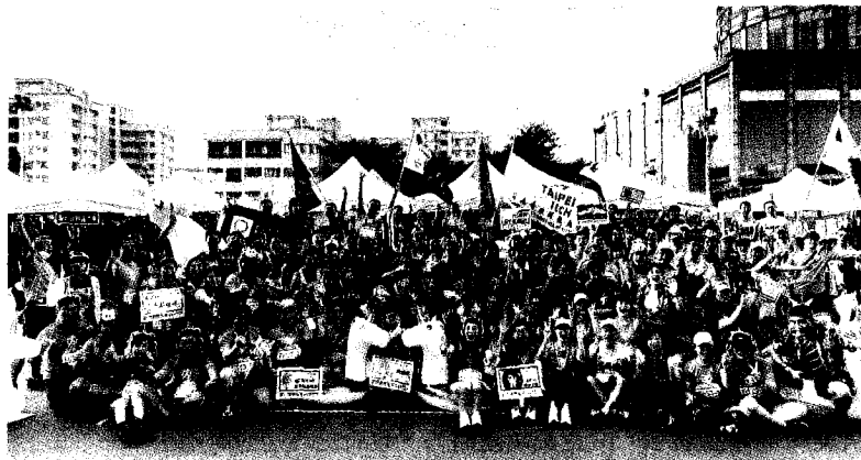
全國EMBA校園馬拉松接力賽，北科大獲頒團結賞。

【台北訊】2022全國EMBA校園馬拉松接力賽日前在成功大學舉行，總共有28校1,700多位選手參加，由於去年停辦，今年又逢政府全面解封，參與人數及隊伍創新高，除了主辦單位，北科大是最積極響應