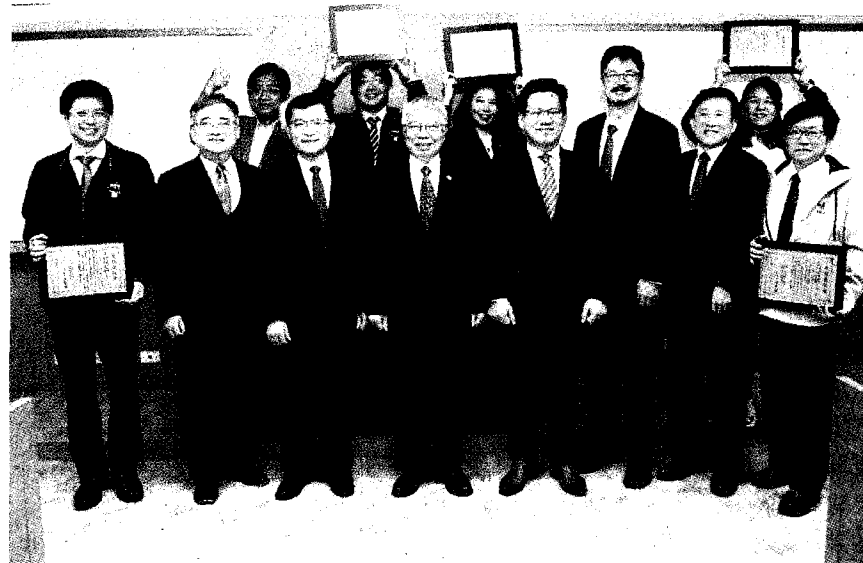
▲北科大、聯輔基金會合作「高階財務管理人才聯合培育計畫」頒發最佳團隊獎。

優秀的工程人才，未來的一百年將是管理人才的時代，對於承擔企業發展重任的EMBA加強理論與實務的訓練，協助專業經理人和企業家培養面對國際競爭及前瞻科技時代的應變與決策能力。