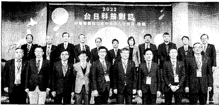
台日科技論壇，希望藉本次論壇機會，台科大與東工大可以創造更緊密合作，為台灣技職教育培育一流半導體人才。

【記者周貞伶、王志誠／台北報導】為強化半導體產業在全球市場競爭優勢，台灣科技大學與台灣日本研究院、立法院亞東國會議員友好協會，共同假台灣科技大學舉辦「二〇二二年台日科技對話：半導體科技的戰略合作與人才育成」國際論壇。國立台灣科技大學校長顏家鈺說，希望藉本次論壇機會，台科大與東工大可以創造更緊密合作，為台灣技職教育培育一流半導體人才。